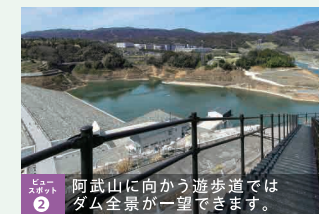
ポイント ② 阿武山に向かう遊歩道ではダム全景が一望できます。