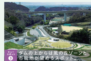
ポイント ③ ダムの上からは風の丘ゾーンと市街地が望めるスポット。