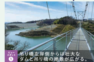
ポイント ① 吊り橋左岸側からは壮大なダムと吊り橋の絶景が広がる。